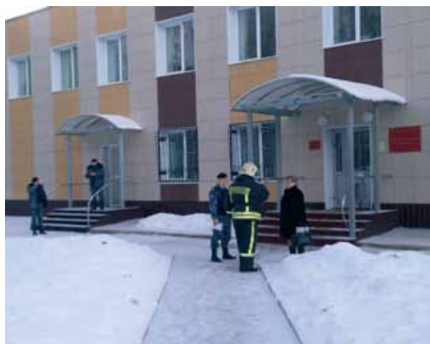
Проведение учебного тренировочного занятия в Ковдорском районном суде Мурманской области