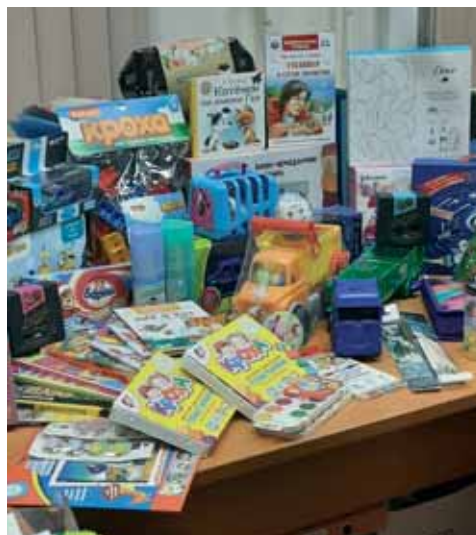
Подарки в рамках ежегодной благотворительной акции «Подари ребенку праздник»

В наших с вами силах в канун Нового года подарить радость и тепло детям, которые лишены родительской любви.