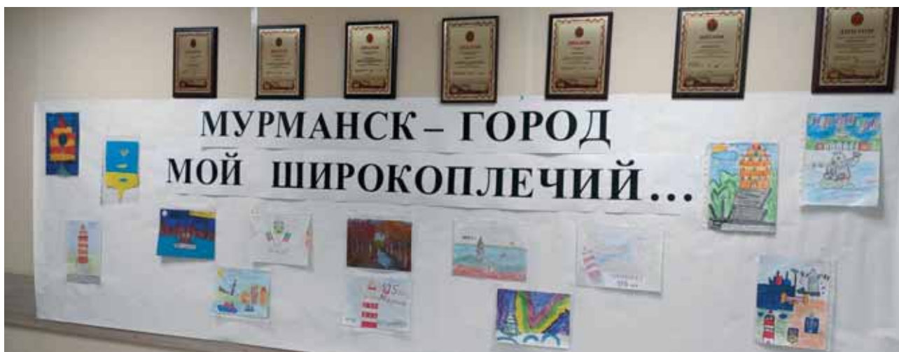
Конкурс детского рисунка ко Дню города

Место, где родился и вырос человек, называется его малой родиной. У многих людей именно с малой родиной связаны самые добрые и светлые воспоминания детства. Целью проведения выставки детского рисунка является гражданско-патриотическое воспитание и формирование у подрастающего поколения интереса к истории города, чувства любви и бережного отношения к своей малой родине.