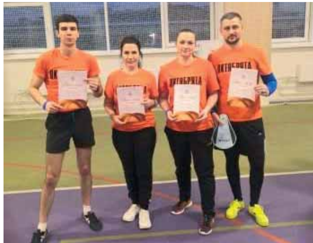
Команда Октябрьского районного суда г. Мурманска

Поздравляем все команды с достойными результатами, желаем удачи в дальнейших спортивных соревнованиях и новых побед!