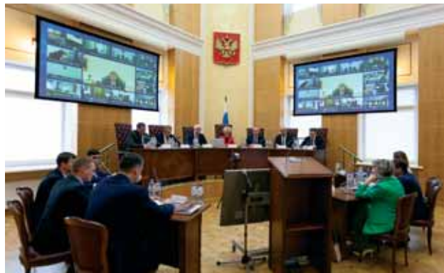
Организаторы семинара и выступающие лица