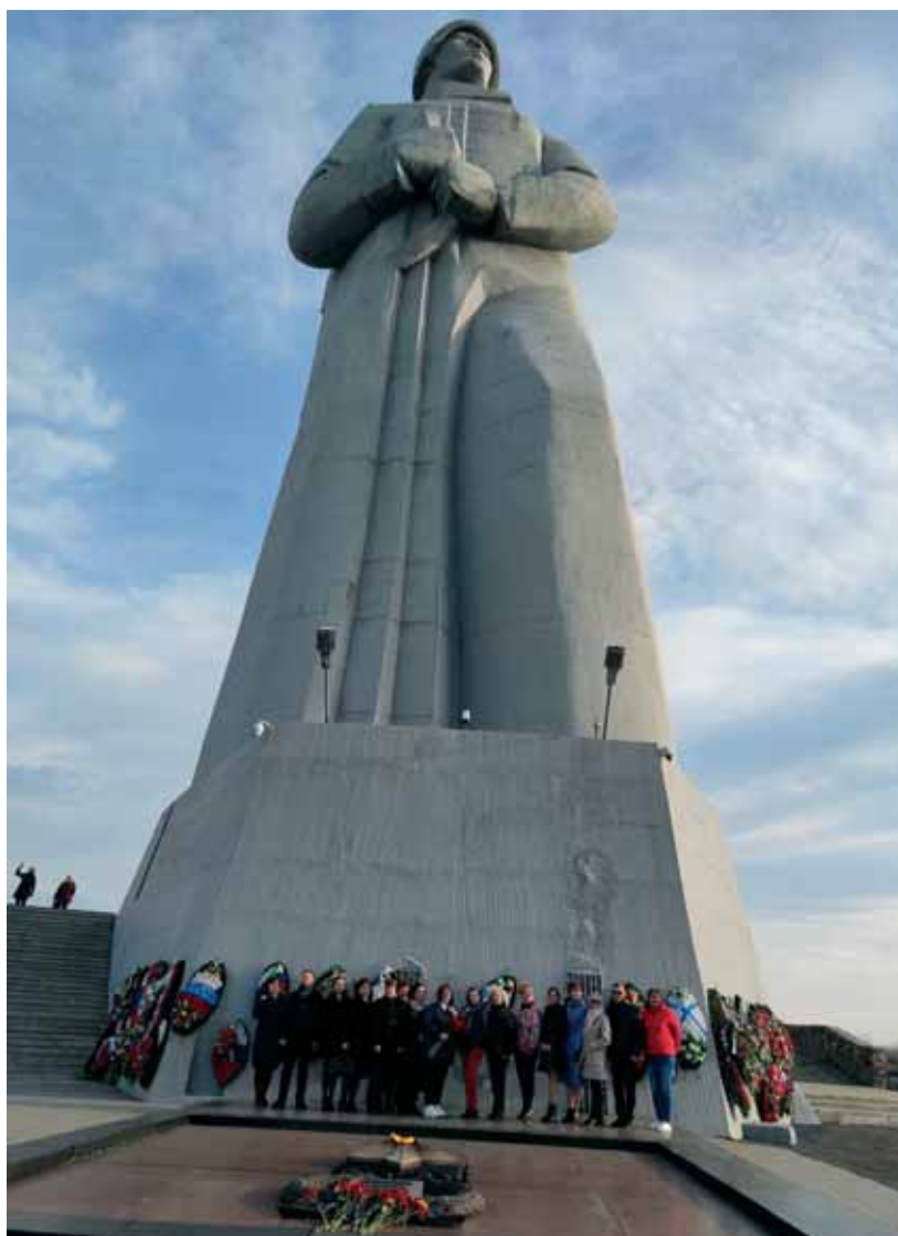
Судьи и сотрудники аппарата суда возложили цветы к подножию мемориала Защитникам Советского Заполярья в годы Великой Отечественной войны

Напомним, мемориал Защитникам Советского Заполярья в годы Великой Отечественной войны – Мурманский Алеша был открыт 19 октября 1974 года. 9 мая 1975 года в мемориальном комплексе были захоронены останки Неизвестного солдата и зажжен Вечный огонь. Находится мемориал в Ленинском административном округе города Мурманска на сопке Зеленый мыс. 35-метровый воин смотрит в сторону Кольского залива, оберегая покой мурманчан. Мемориал является одним из любимых мест жителей Мурманска и обязательным для посещения гостей города.