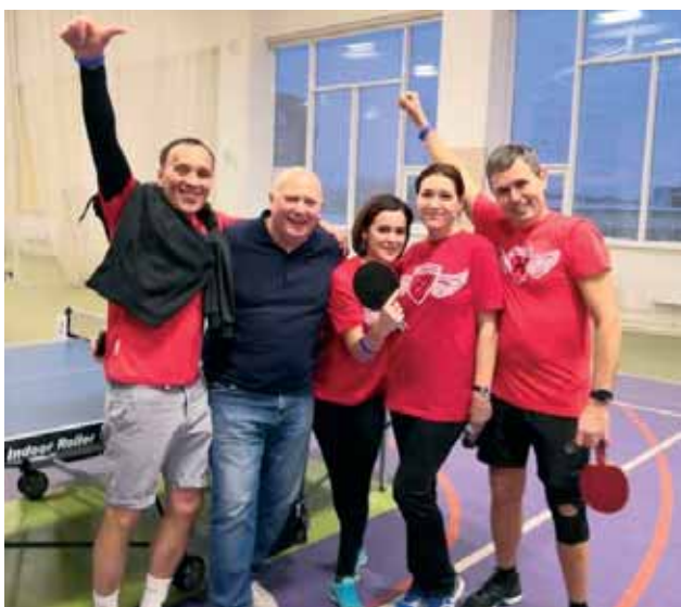
Команда Мурманского областного суда