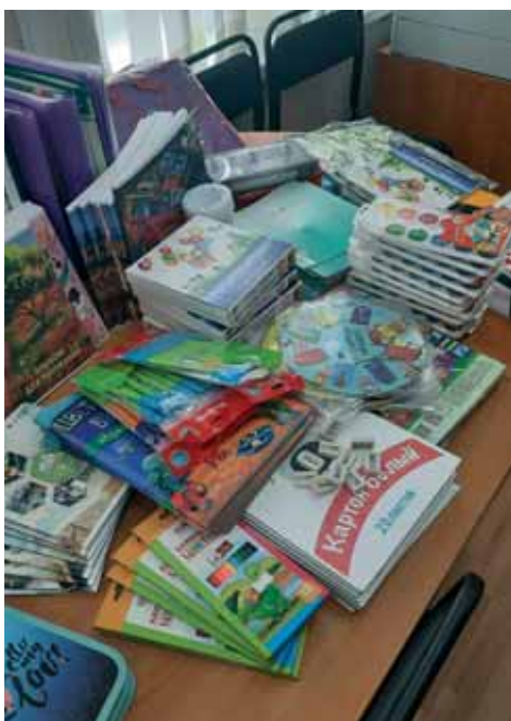
Канцелярские и письменные принадлежности для детей в преддверии Дня знаний

28 августа 2021 года в преддверии Дня знаний судьи и сотрудники аппарата Ковдорского районного суда приняли участие в ежегодной благотворительной акции, инициированной комиссией по делам несовершеннолетних и защите их прав администрации Ковдорского района под названием «Собери ребенка в школу», призванной помочь многодетным семьям и семьям, попавшим в трудную жизненную ситуацию, подготовить детей к началу учебного года.