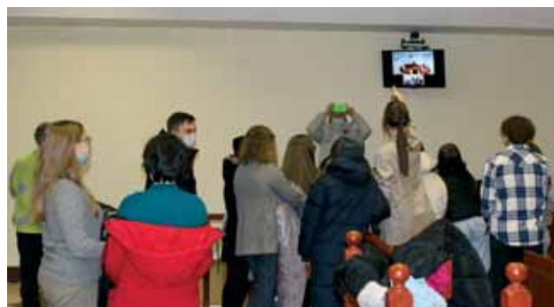
Школьники на экскурсии в Кандалакском районном суде Мурманской области

Подводя итоги, можно с уверенностью сказать, что такие мероприятия повышают правовую грамотность ребят, формируют правовую культуру в обществе, вырабатывают у детей уважение к судебной системе, являются профилактикой правонарушений среди подрастающего поколения, а также могут служить ориентиром для выбора будущей профессии.