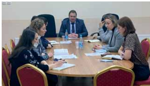
Представители Управления Судебного департамента в Мурманской области, филиала ФГБУ ИАЦ Судебного департамента в Мурманской области и АО «Почта России»

30.11.2021 в Управлении Судебного департамента в Мурманской области состоялось рабочее совещание по вопросу пересылки почтовых отправлений в форме электронного документа, в котором приняли участие работники аппарата судов, представители ФГБУ ИАЦ Судебного департамента в Мурманской области, АО «Почта России».