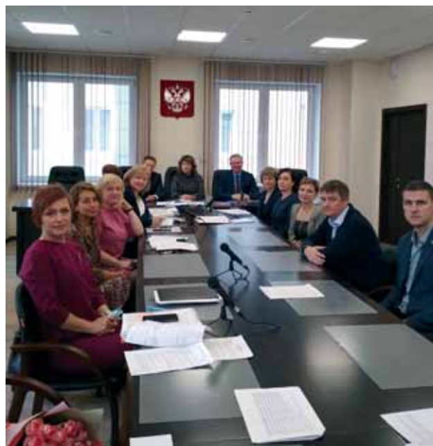
Члены нового состава Совета судей Мурманской области