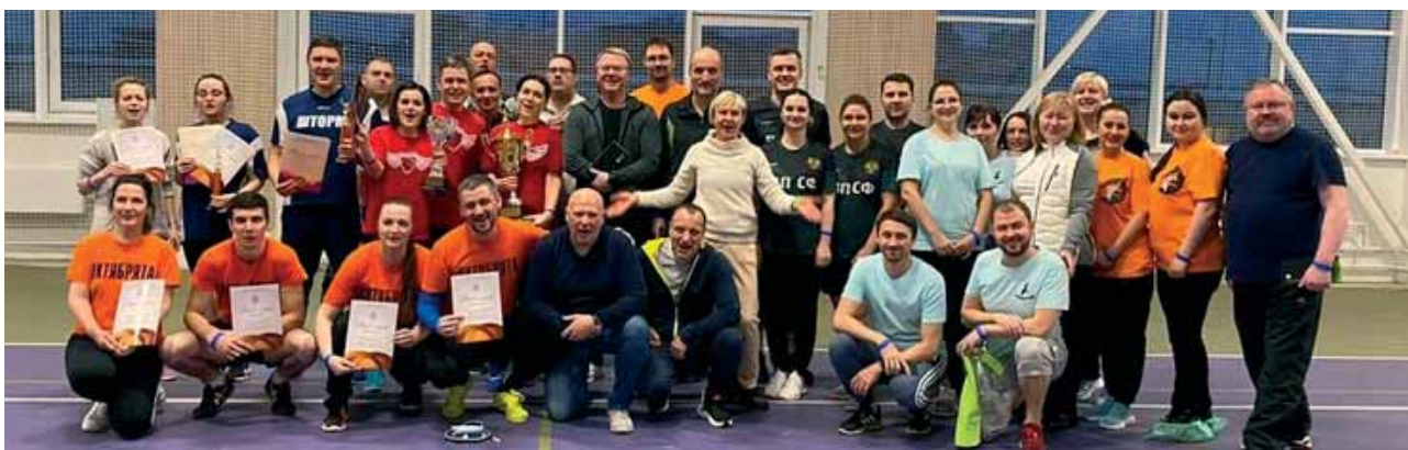
Участники турнира по настольному теннису