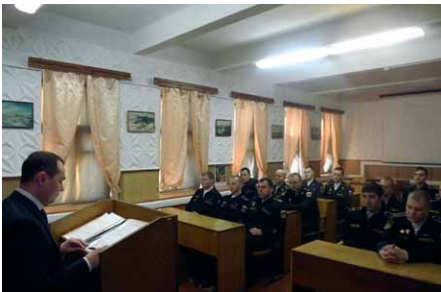
Перед военнослужащими Кольской флотилии разнородных сил СФ выступает судья Полярнинского гарнизонного военного суда Сергей Дудник

неблагополучных по состоянию воинской дисциплины и правопорядка воинских частях и были направлены на сплочение коллективов, формирование в них здоровой моральной обстановки.