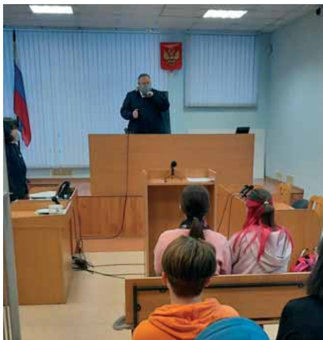
Восьмиклассники МБОУ СОШ № 1 п. Никель на экскурсии в Печенгском районном суде Мурманской области

30 ноября 2021 года, в рамках Дня юриста, который отмечается в России 3 декабря, Печенгский районный суд Мурманской области приветствовал в своих стенах восьмиклассников МБОУ СОШ № 1 п. Никель.