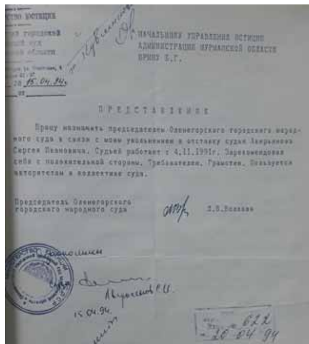
Представление председателя Оленегорского городского народного суда Волковой Л.В. о назначении Аверьянова С.И. председателем

ступил к исполнению обязанностей председателя суда, а позже – Указом Президента РФ от 23 июля 1998 года № 882 был назначен председателем суда и возглавлял его до ухода в почетную отставку 29 ноября 2013 года.