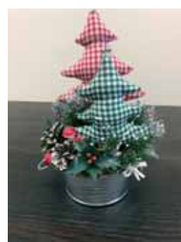
Работы участников конкурс новогодних поделок «Новогодние фантазии»