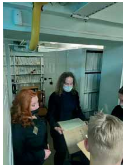
Школьники на экскурсии в Первомайском районном суде Мурманской области