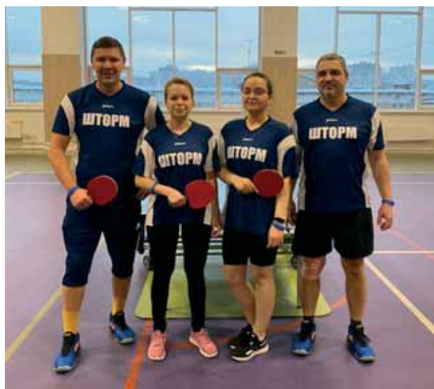
Команда Северного флотского военного суда