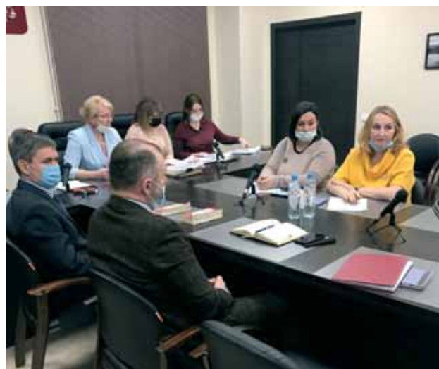
Конкурсная комиссия по организации и подведению итогов общественных смотров – конкурсов