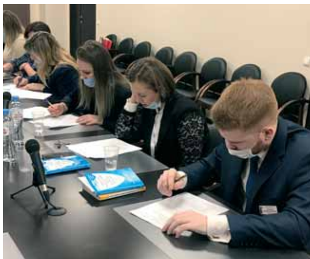
Конкурсанты выполняют задание теоретического и практического характера