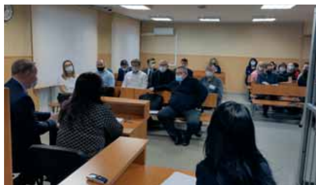
Судьи и помощники судей Ленинского районного суда города Мурманска с представителями ГОБУЗ «Мурманский областной психоневрологический диспансер»

Участники семинара обсудили актуальные вопросы, возникающие при рассмотрении указанной категории дел, определили пути их разрешения с целью максимального соблюдения прав, свобод и законных интересов лиц, в отношении которых заявляются адми-