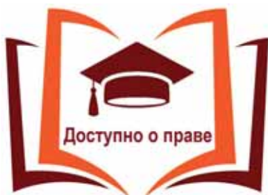
Эмблема регионального проекта «Доступно о праве»