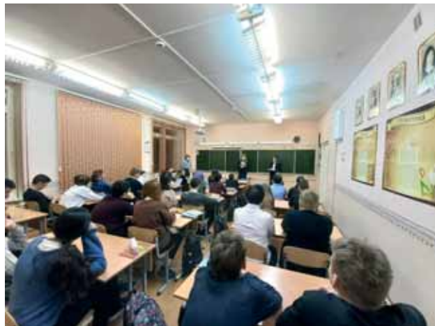
На встрече с учащимися МБОУ ООШ № 2 г. Ковдора

Сотрудники суда рассказали ребятам о существующих видах ответственности согласно действующему законодательству, разъяснили с какого возраста наступает каждый вид ответственности, какие меры могут быть применены к правонарушителям, о наиболее