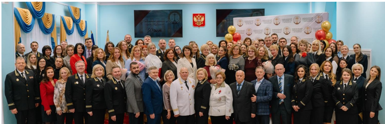
На фото: председатели судов области, представители органов судейского сообщества, ветераны, судьи в почетной отставке, коллектив Первомайского районного суда г. Мурманска

Первомайский районный суд г. Мурманска прошел большой путь организационного становления и зарекомендовал себя как надежный институт правосудия, сохраняющий традиции профессионализма и служения закону.