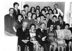
На фото: коллектив суда 1990-1992 гг.