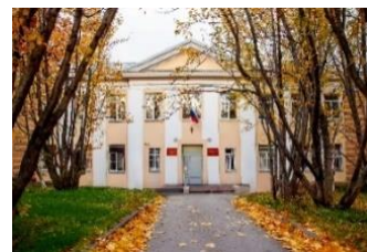
На фото: торжественное открытие суда на пр. Ленина, д.2

В 2010 году были образованы три отдела: общий, отдел обеспечения судопроизводства и контроля по уголовным делам, отдел обеспечения судопроизводства и контроля по гражданским делам.