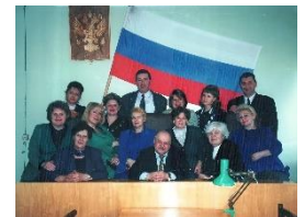
На фото: коллектив суда 2001 г.

С 1 января 1997 года, в связи со вступлением в силу Федерального конституционного закона от 31.12.1996 № 1 ФКЗ «О судебной системе Российской Федерации», суд получил современное наименование — Первомайский районный суд города Мурманска.