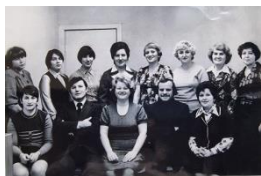
На фото: коллектив суда 1976 г.