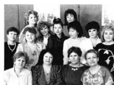
На фото: коллектив суда 1980-1983 гг.