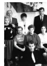
На фото: коллектив суда 1990-1992 гг.