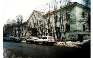
На фото: здание суда ул. Генералова, д. 10

В декабре 1981 года суд переехал в новое здание по адресу: улица Генералова, дом 10, где работал вплоть до января 2005 года.