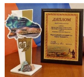
Кубок, Диплом «Лучший суд года Мурманской области» за 2021 год

Суд не раз подтверждал высокий уровень профессиональной работы. В 2012, 2020, 2021 и 2023 годах суд был признан лучшим в категории районных судов Мурманска по итогам конкурса «Лучший суд года Мурманской области».