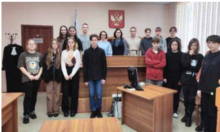
На фото: учащиеся 8В класса СОШ № 4 во время экскурсии в суде