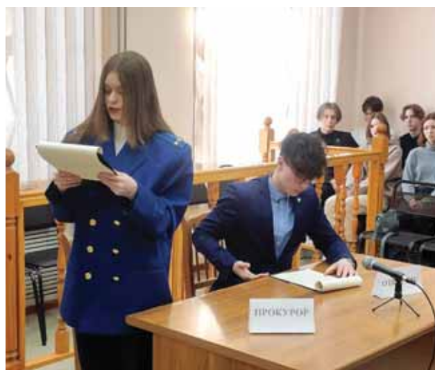
На фото: инсценированный судебный процесс