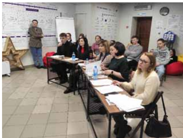
На фото: экспертная комиссия

14.04.2023 и 28.04.2023 в Полярнозоринском районном суде состоялась деловая игра «Судебное разбирательство в гражданском процессе», участниками которой стали старшеклассники МБОУ Гимназия № 1 и студенты Полярнозоринского энергетического колледжа (группа «Право и судебное администрирование»).