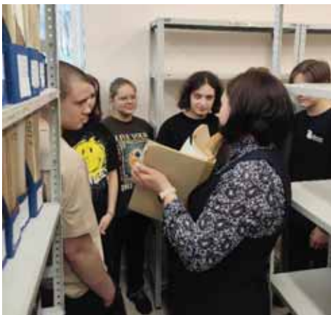
На фото: в архиве суда