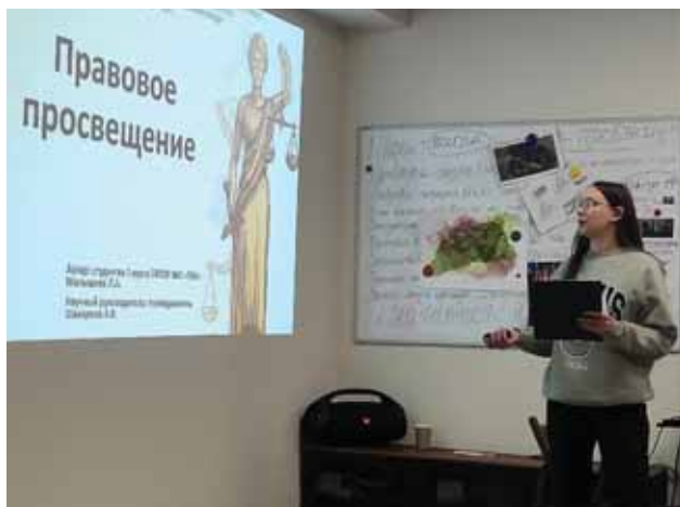
На фото: защита проектно-исследовательской работы