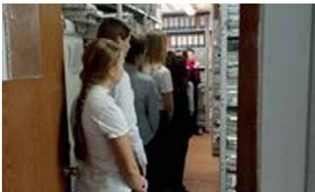
Архив Арбитражного суда Мурманской области