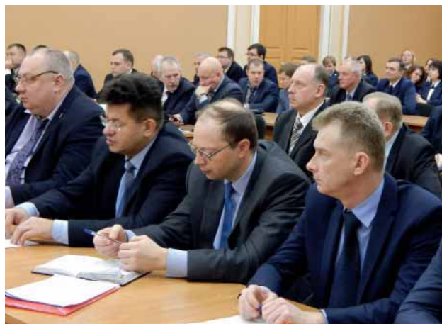
В ходе работы совещания