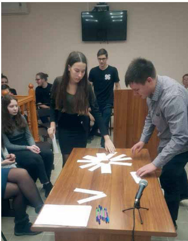
Участие школьников в блицопросе

29 ноября 2018 года в Полярнозоринском районном суде в рамках Дня правовой помощи детям для учащихся 10-го класса МБОУ СОШ № 4 г. Полярные Зори прошла интеллектуальная игра «В мире права». Мероприятие такого формата проводилось впервые, целью его было не выбрать лучших, а зародить интерес к изучению права.