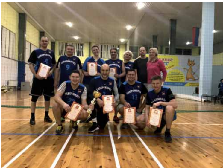
Работники судов Североморска – победители соревнований