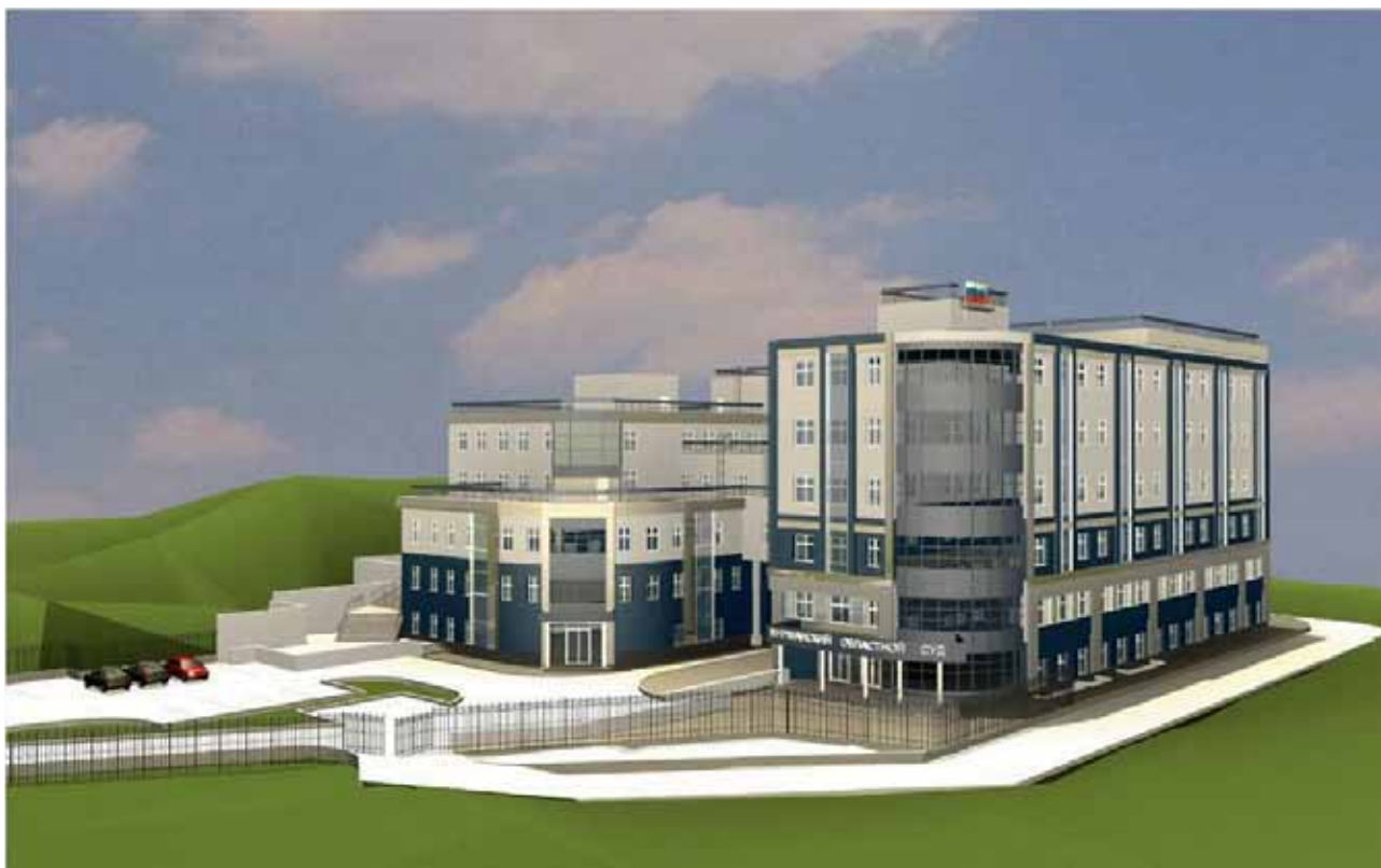
Макет здания Мурманского областного суда

1 августа 2018 года началось долгожданное строительство нового здания Мурманского областного суда, которое будет располагаться по улице Полярные Зори. Сейчас на данном земельном участке находится недостроенное офисное здание, реконструкция которого уже началась.