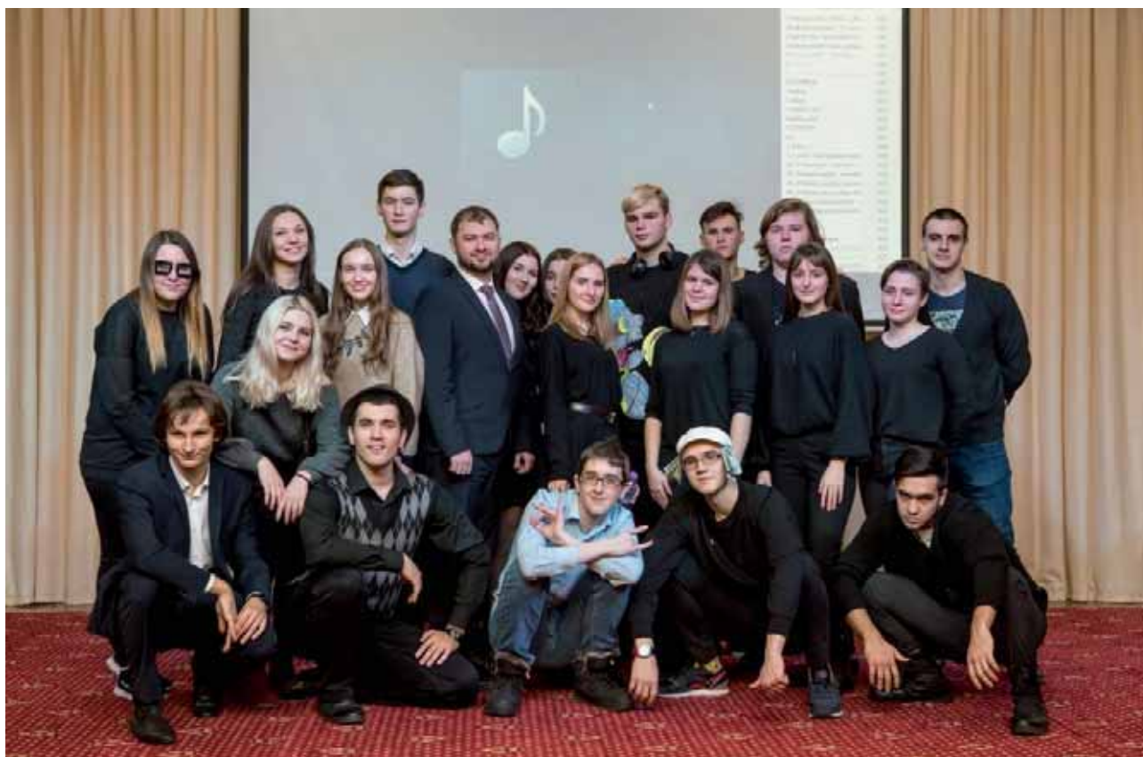
Студенты СЗФ Московского гуманитарно-экономического университета провели юридический КВН

ных сферах, пытались ответить на вопросы жюри, например, чем отличается хороший юрист от плохого?