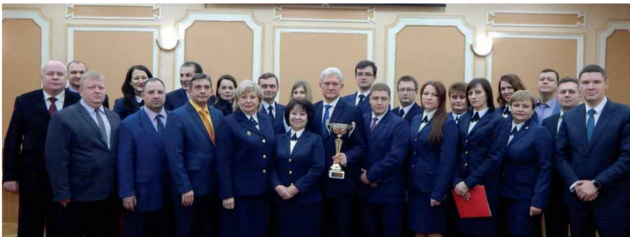
Коллектив Североморского ГВС четвертый раз признан лучшим