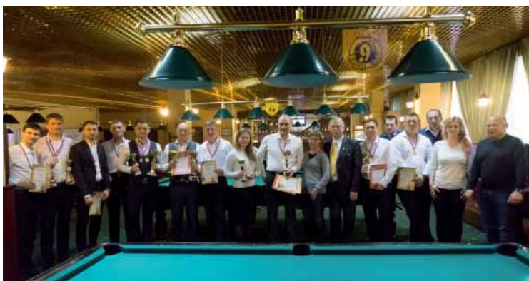
Турнир по бильярду среди работников судебной системы Мурманской области

Вот уже несколько лет проводится праздничное мероприятие, посвященное Дню юриста, на котором Мурманским областным судом, Арбитражным судом Мурманской области, Северным флотским военным судом, Управлением Судебного департамента в Мурманской области, Советом судей Мурманской области и Мурманским региональным отделением Общероссийской общественной организации «Российское объединение судей» награждаются лучшие судьи и сотрудники аппаратов судов.