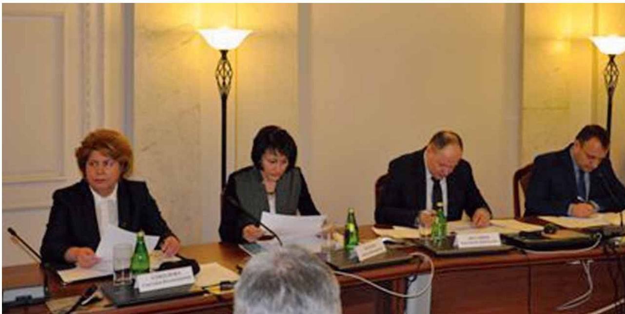
Совещание представителей арбитражных судов, февраль 2018 года