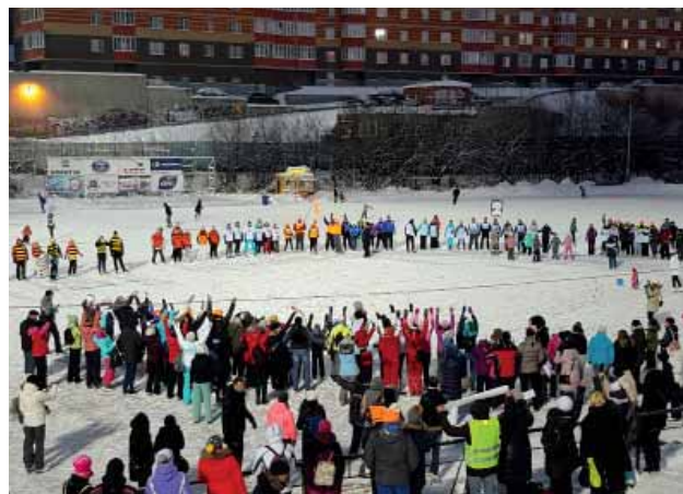
Второй спортивно-оздоровительный праздник на стадионе «Строитель»