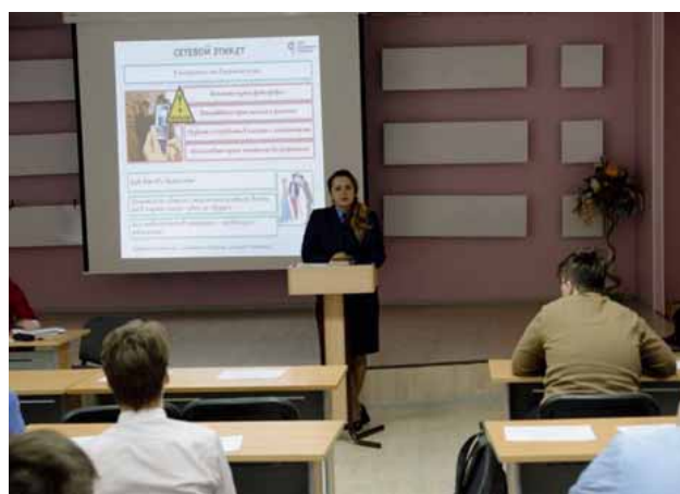
Учащимся представлена презентация на тему: «Безопасность детей в сети Интернет»