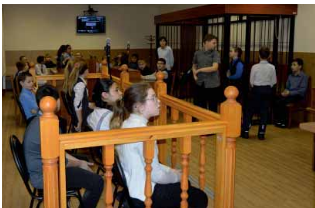
Ребята почувствовали себя в роли присяжных заседателей