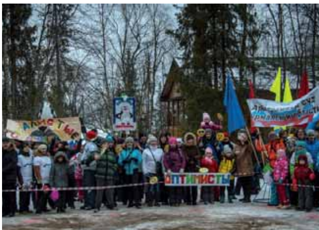
Спортивно-оздоровительный праздник на туристической базе отдыха «Теремок»