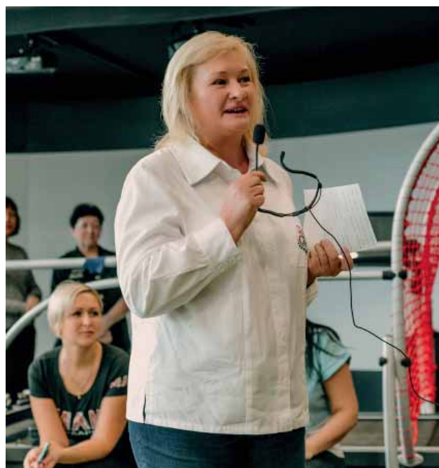
Приветственные слова участникам соревнований - 2018