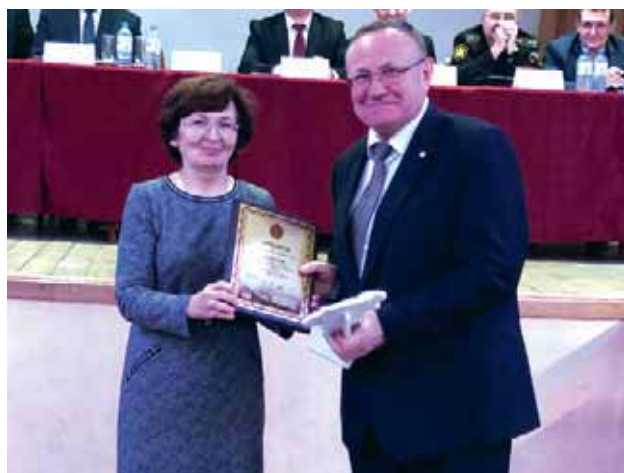
А.И. Хомякову для Североморского гарнизонного военного суда