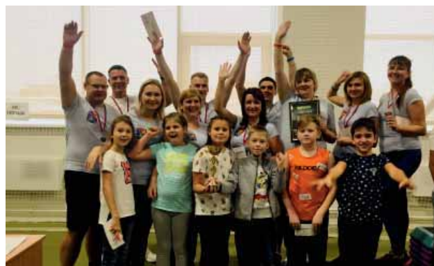
Команда Полярнинского ГВС с детьми