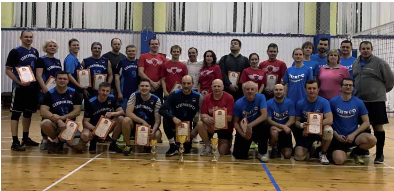
Команды – участники турнира, занявшие призовые места

духа! Пусть эта живая, веселая и интересная игра всегда держит вас в тонусе и настраивает на позитивную волну!