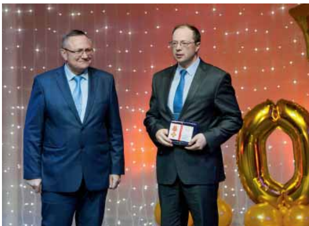
Медали Судебного департамента при Верховном Суде Российской Федерации вручаются судьям Северного флотского военного суда Владимиру Чернышову и Олегу Сизову