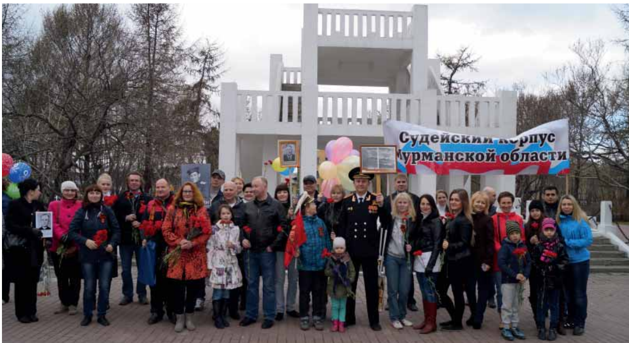
День Победы – главный праздник

Чтобы память о героях Великой Отечественной войны не угасала, о них должны помнить и знать их потомки, ведь нет ни одного человека в России, родственники, близкие люди которого не участвовали бы в той страшной войне.