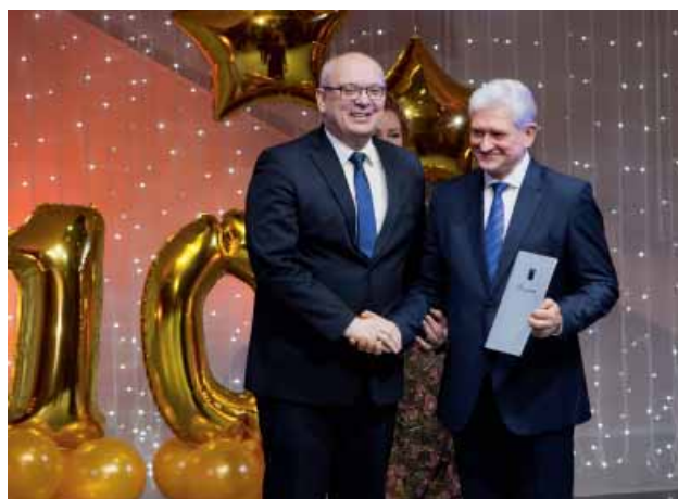
Благодарность главы ЗАТО г. Североморск – председателю Северноморского гарнизонного военного суда Игорю Бельскому