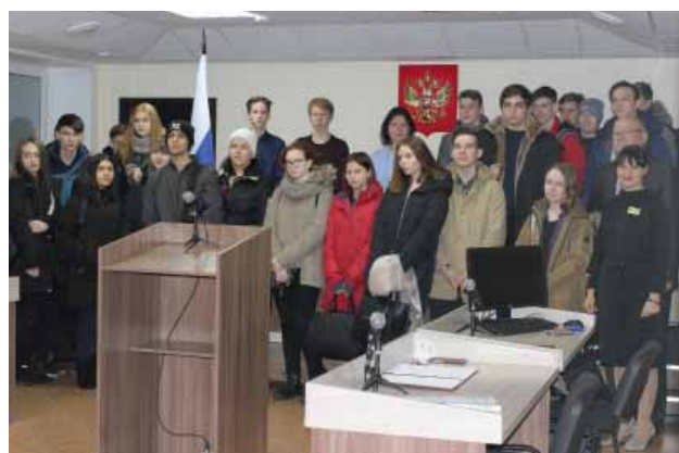
День открытых дверей для учащихся

Учащиеся совместно с педагогом остались довольны проведенным мероприятием, выразили желание в дальнейшем продолжить подобные встречи, которые не только помогают школьникам определиться с выбором дальнейшей профессии, но и способствуют повышению правовой грамотности.