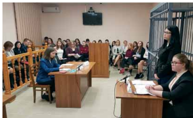
Деловая игра «Судебное заседание по уголовному делу»

В рамках Всероссийского Дня правовой помощи детям в Полярнозоринском районном суде 30 ноября 2018 года состоялась деловая игра «Судебный уголовный процесс», участниками которой стали студенты ГАПОУ МО «Полярнозоринский энергетический колледж».