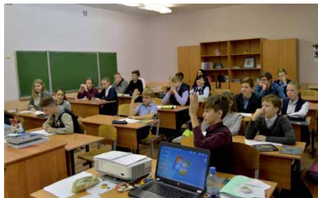
Ученики готовы ответить на вопросы сотрудников суда

Ребята с интересом заслушали выступления гостей, задавали вопросы, делились своими мнениями и впечатлениями. Некоторые учащиеся всерьез высказали свои пожелания по поводу своего дальнейшего выбора профессии и отметили, что в будущем хотят служить Закону и быть профессионалами своего дела.