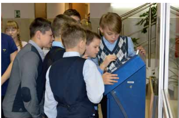
Ребята изучают информационный киоск