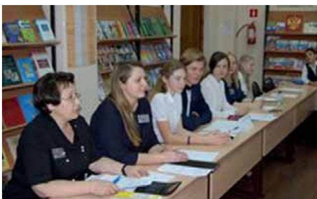
Игра на тему «Банкротство физических лиц»

В ходе игры ребята принимали активное участие, проявляли инициативу, неподдельную заинтересованность и отлично справились с поставленной перед ними задачей!