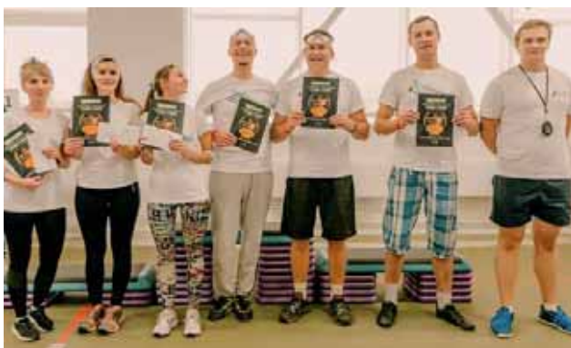
Команда Арбитражного суда Мурманской области

12) «Ну, погоди!» – Североморский гарнизонный военный суд.