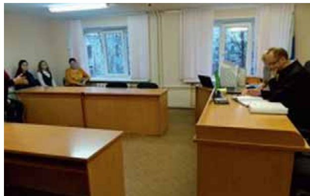
Судебное заседание с учащимися школы