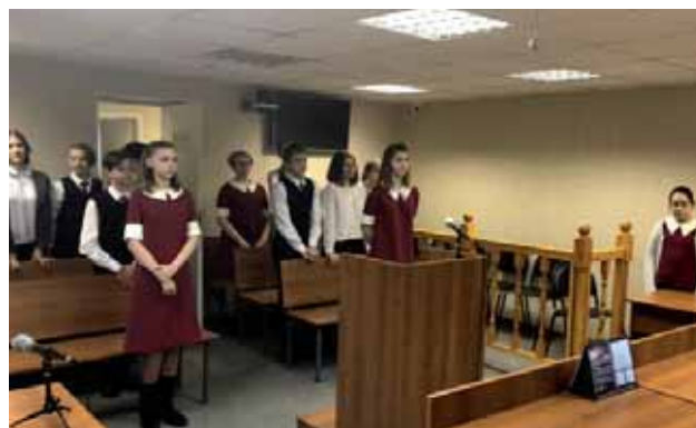
Инсценировка судебного заседания

Ребята наглядно познакомились с судебной властью и спецификой ее работы, узнали о важности знания Закона, своих прав и обязанностей.