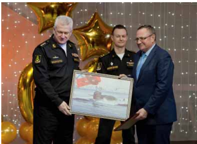
Памятный подарок от командующего Северным флотом адмирала Николая Евменова