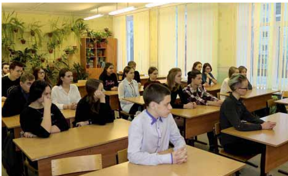
Учащиеся внимательно слушают выступающего

20 ноября проводится День правовой помощи детям, который приурочен к празднованию Всемирного Дня ребенка. В этот день в 1959 году ООН приняла Декларацию прав ребенка. В этот же день, но в 1989 году была принята также Конвенция о правах ребенка.