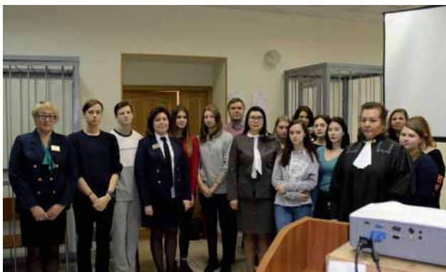
Сотрудники суда и студенты Кооперативного техникума