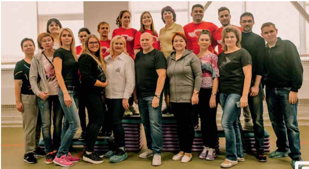
Победители соревнований – Мурманский областной суд

27 октября 2018 года в фитнес-клубе «X-Fit» прошли традиционные спортивные соревнования среди судов области под девизом «Спорт – здоровье, спорт – игра». Мероприятие организовано Мурманским отделением Общероссийской общественной организации «Российское объединение судей» при поддержке органов судейского сообщества.