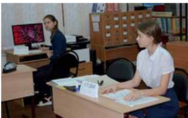
Ученики в роли судьи и секретаря судебного заседания